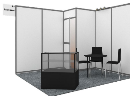
2. Stand équipé