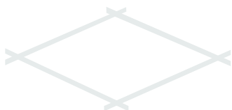
1. STAND NU